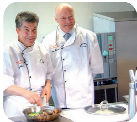
Régis Marcon et Alain Rousset ensemble pour la promotion de l'apprentissage

L'année 2010 fut riche en rencontres avec des invités extraordinaires et talentueux qui sont venus promouvoir la formation des jeunes par le biais de l'apprentissage.